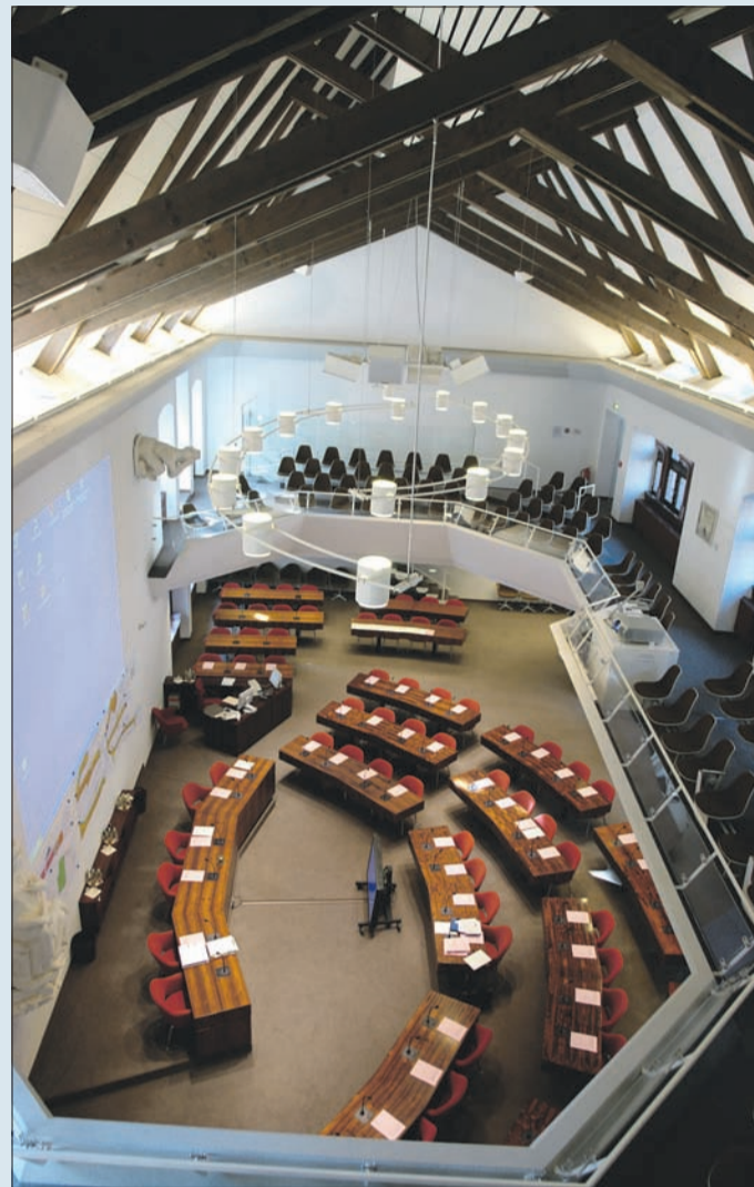
Nur 48 der 591 Bewerber und Bewerberinnen werden es auf die Sessel im Ratssaal schaffen.

Gemeinderatswahl, bei allen weiteren ist der Eingang ihrer Unterlagen entscheidend. Da die Liste Junges Freiburg sich neu gegründet hat, wurde sie unter den Neubewerbern eingereiht. Die folgende Übersicht enthält alle Bewerberinnen und Bewerber mit Nummer, Name, Anschrift und Geburtsjahr. Mit 54 Prozent sind Männer gegenüber Frauen geringfügig überrepräsentiert. Die Kandidatinnen und Kandidaten sind zwischen 18 und 82 Jahren alt, und das Durchschnittsalter liegt bei rund 47 Jahren.